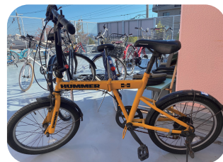
中古自転車の販売もあるよ

今や、定番となったキララフェスタ♪今年も開催されます。カレーに続き、オリジナルブレンドコーヒーが満を持して登場です。そして大人気のキララセット（カレーとデザートセット）が2種類数量限定で販売することが決まりました！シフォンケーキやクッキーなどお菓子もたくさん用意しています。