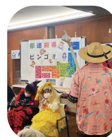
盛り上がったビンゴ大会

机が浮遊したり、なんと帽子の中から鳩が現れたり、みんな拍手喝采で盛り上がりました。ゲストの方が来てくれると何かと刺激となりますね(^_^)