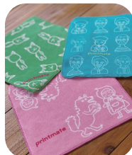
人気のミニタオルも売っています