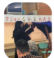
机が浮くマジックに感動☆