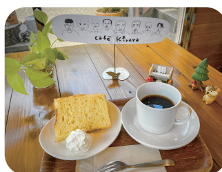
ふわふわのシフォンケーキもオススメ

ほかにも、中古自転車や可愛い自主製品などの販売、催し物も予定していますので、ぜひご家族そろってお越しください。