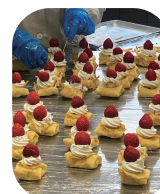
忘年会のご馳走♪美味しそう