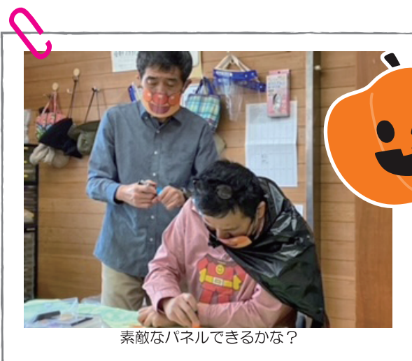
素敵なパネルできるかな？