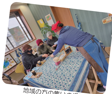
地域の方の集いの場に