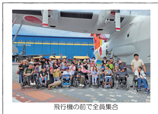
飛行機の前で全員集合

数ヶ月前から利用者で構成された旅行実行委員のメンバーが楽しい企画を考えてくれ、思い出いっぱいの旅行となりました。11月はアクティブグループの旅行です。今から楽しみです。