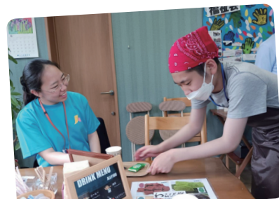
お待たせしましたあ