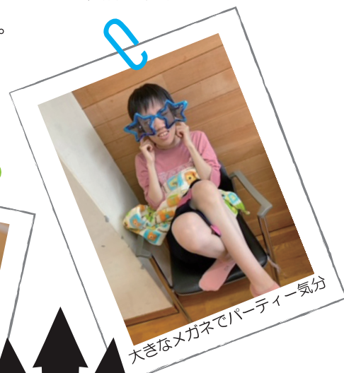
大きなメガネでパーティー気分