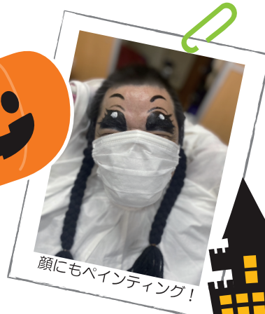
顔にもペインティング！