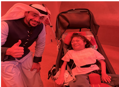
優しいクウェートのお兄さんと