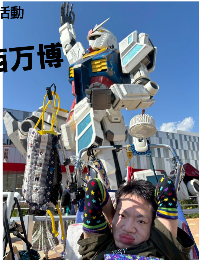
世界のガンダムだ!!