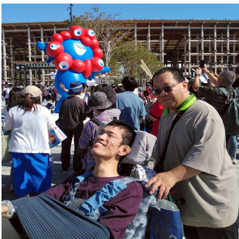
ミャクミャクと大屋根リング

9月30日と10月1日に2グループに分かれて、3階班が大阪・関西万博に行ってきました。何日も前から予約を取り、今か今かと待ちわびていました。いざ会場につくと見渡す限りの人！人ごみをかき分けながら目指すはパビリオン。