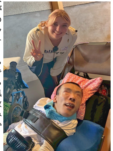
ドイツ館のスタッフと笑顔で

光・音楽・香りなど様々な感覚を刺激してきます。パビリオン内でも記念撮影。海外の人と一緒にパシャリ。笑みがあふれていました。科学の進歩もすごいですね。ロボットアームに目を奪われ、その場を動けませんでした。これから何が起こるんだろうとワクワクがいっぱいです。大屋根リングの上もいってきました。気持ち良い風が吹いていて、いつもの散歩とは違う雰囲気を楽しみました。そして後ろ髪をひかれながら、帰路につきました。大阪・関西万博最高でした!!