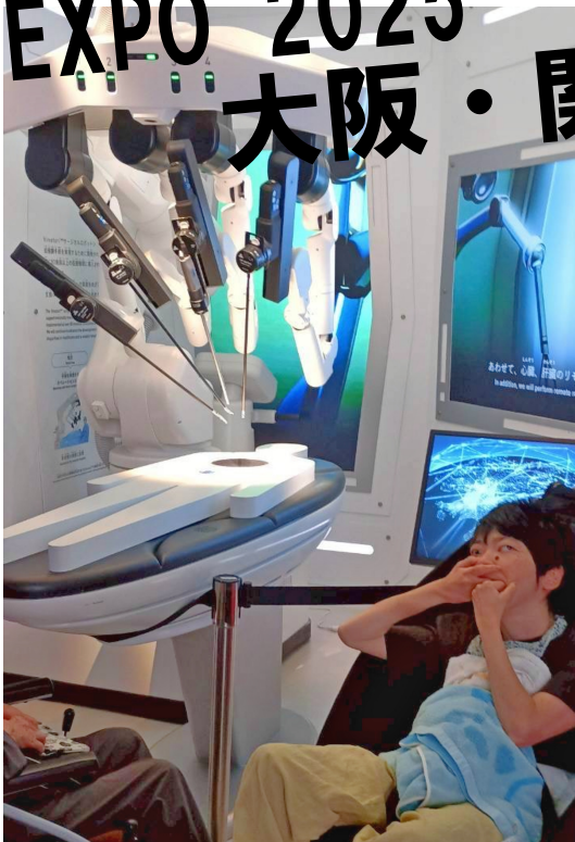
遠隔操作のロボットアームにビックリ！