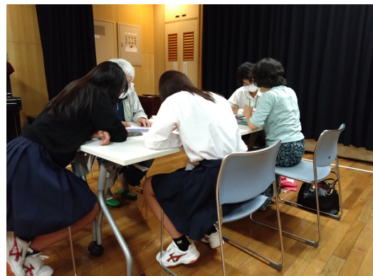
教える方も教わる方も真剣