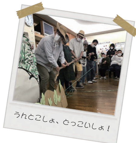
うんとこしょ、どっこいしょ！

見て、動いて、歌って楽しい時を過ごすことができました。次回公演はいつになるのでしょうか！？お楽しみに！！