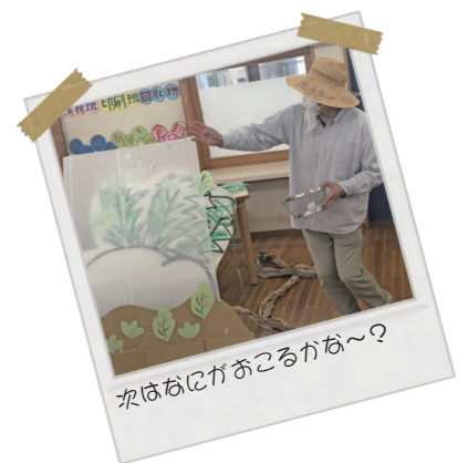
かばねにがおこるかな〜？