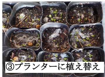
③プランターに植え替え

レモンバームは葉・茎・花の部分がハーブとして使用できるようで、さわやかな香りがする「シトラル」という成分が含まれており、香りを楽しむハーブティーや料理にも使え、楽しみ方は様々なよう