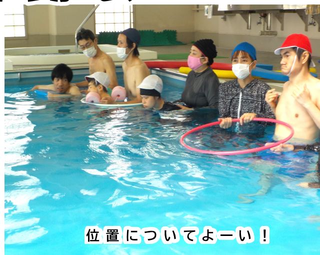
位置についてよーい!

当施設には、室内温水プールがあり、今年は数年ぶりに継続したプール活動を行なうことができたので、ピース班のみんなとプールで水中運動会を開催しました。種目はリレーと玉入れです。