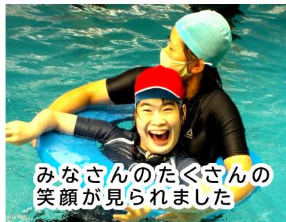
みなさんのたくさんの笑顔が見られました

あいほうぶの利用者の皆さんも水中運動会の後は、ジャグジーや採暖室を利用し、みんなでほっこりした時間を過ごし、後の表彰式に備えました。