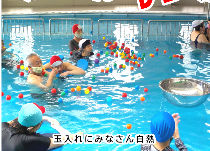
玉入れにみなさん白熱