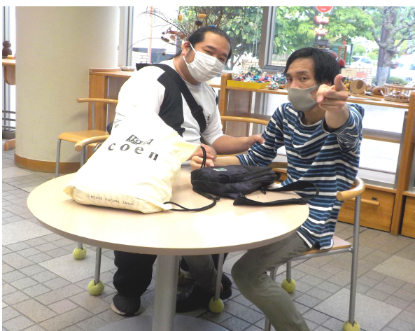
プールの後は喫茶スペースでヘルパーさんとのんびり

あいほうぶに到着するとまず受付でカウンターに置いてある書類の向きを変えます(こだわりで